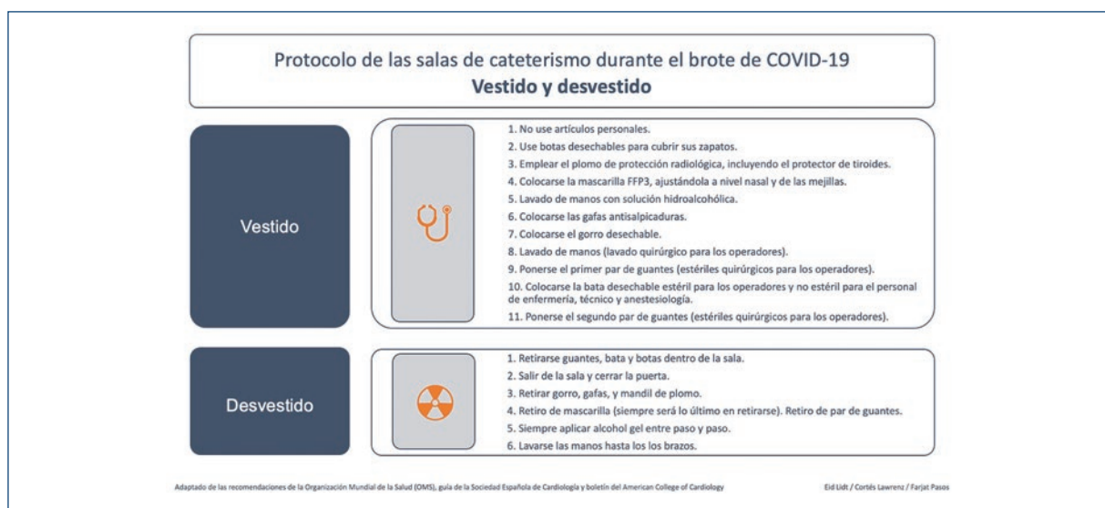
Figura 2. Protocolo de vestido y desvestido durante el brote de COVID-19.